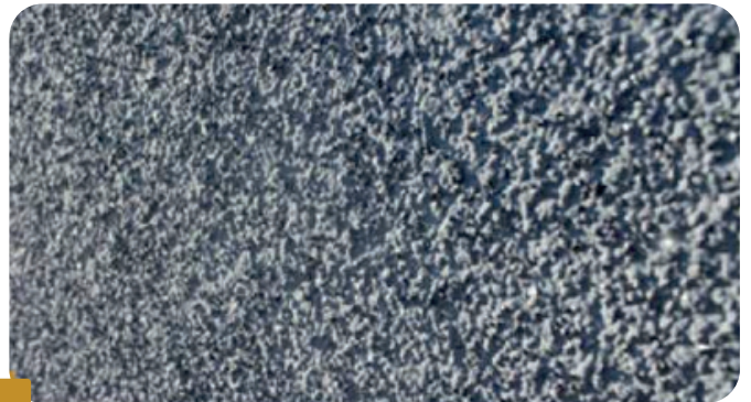
Fot. 3 HOTOVÝ EFEKT BOLIX DIAMENT

Pištoľ držte vo vzdialenosti približne 30 - 50 cm od podkladu a pohybujte krúživým pohybom tak, aby mali jednotlivé kruhy priemer cca 20-25 cm, zároveň sa posúvajte vodorovne a/alebo zvislo. Lúč musí byť nasmerovaný kolmo na podklad. Nezaбудnite, že vykonávaná vrstva je zároveň finálnou vrstvou a jej vzhľad bude tvoriť finálny vizuálny dojem.