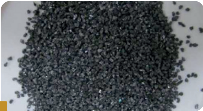
Fot 1 ZRNO KARBIDU KREMÍKA