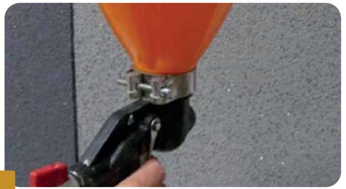
Fot.2 APLIKÁCIA BOLIX DIAMENT NA MOKRÚ OMIETKU POMOCOU PIŠTOLE

Na vyschnutú základnú vrstvu naneste základný náter BOLIX SIG kolor v odtieni 39A. Po zaschnutí základného náteru naneste silikónovú omietku BOLIX SIT 1,5 KA alebo 2,0 KA vo farbe 39A a zhotovte na nej povrchovú štruktúru. Následne na nevzretú mokrú omietku aplikujte suché kamienky BOLIX DIAMENT pomocou pištole pripojenej ku kompresoru. Nesmiete dovoliť, aby omietka preschla