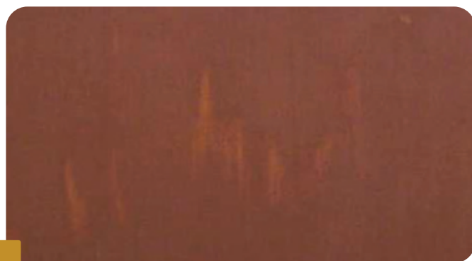
Fot. 3 FINALNY EFEKT