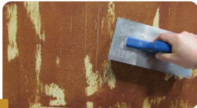
Fot. 2 NANÁŠANIE ĎALŠEJ VRSTVY POMOCOU HLADIDLA

Myslíte na to, že na plochy, na ktoré nebola prvá vrstva omietky nanesená pomocou štetca, budú viditeľné ako svetlejšie odtiene, preto je potrebné ich množstvo a rozmiestnenie vyberať podľa očakávaného vizuálneho efektu. Ďalšiu vrstvu omietky nanášajte pomocou hladidla z nehrdzavejúcej ocele na hrúbku zrna, následne zahladte tak, aby ste odstránili nerovnosti, potom nechajte vyschnúť.