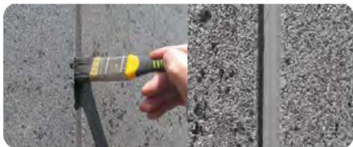
dátum aktualizácie: Novembra 2023

Teplota pri nanášaní a schnutí všetkých komponentov systému by sa mala pohybovať v rozmedzí +5 až +25 °C. Po zaschnutí omietky je potrebné bosážne alebo iné deliace prvky premaľovať farbou BOLIZ AZ alebo BOLIX SIL vo farbe omietky.